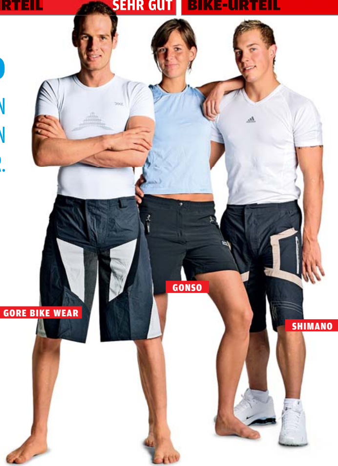
GORE BIKE WEAR

TIPP ZUSÄTZLICHE LÜFTUNGSÖFFNUNGEN MACHEN HEISSE SOMMERTOUREN DEUTLICH ANGENEHMER.