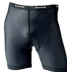
Sugoi „Ricaró 2 Liner“ Innenhose aus Meshstoff, die recht gut belüftet. Das zweilagige Sitzpolster ist angenehm. Bund und Beinabschlüsse sitzen durch Gummibänder fest, am Bein aber zu eng. Eher für schlanke Typen. www.sugoi.com