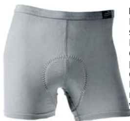
Löffler „X-Light“ Luftig dünne Unterhose aus Mesh. Sitzt am Bund angenehm aber etwas hoch. Das Sitzpolster ist zu groß und dadurch etwas warm. Leider fehlt die Gummierung an den Beinen. www.loeffler.at

Mit der richtigen Unterhose wird auch eine normale Short bequem.